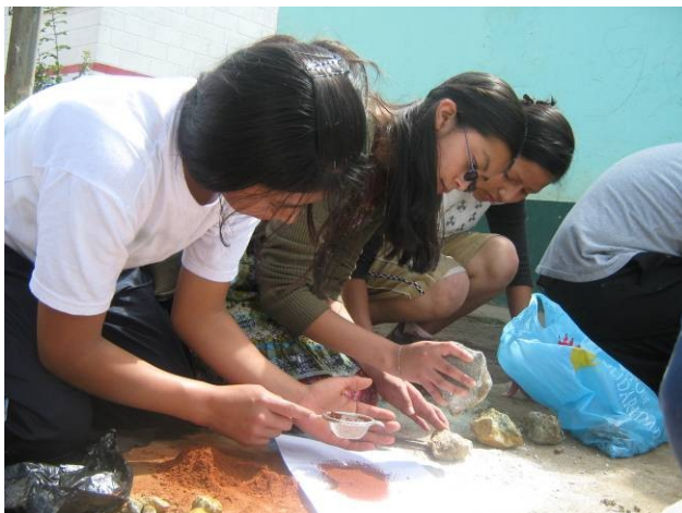
El proceso de preparación de los distintos colores de tierra y rocas.