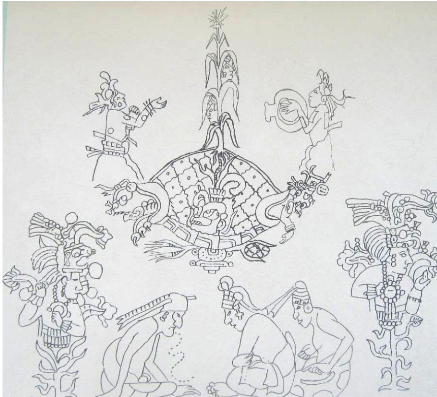
Escenas, concepción del mundo y de la vida Mayab' plasmados en el muro para la muestra del arte de la pintura rupestre.