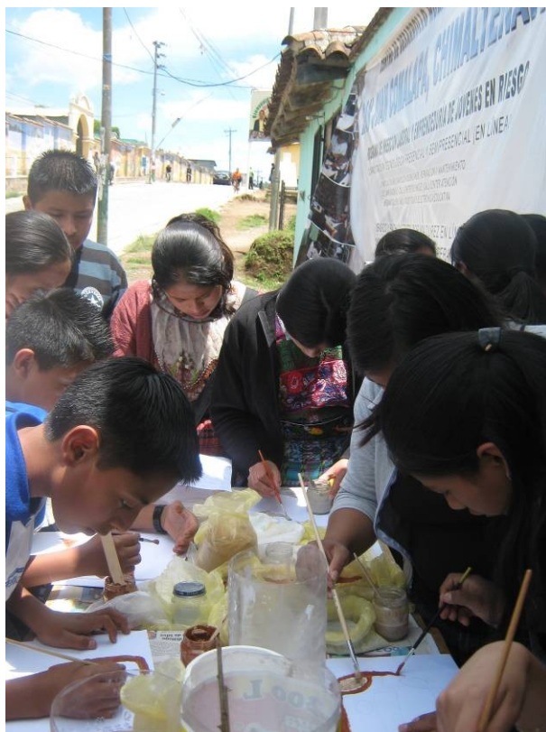
Ejercicios de prueba, elaborados en papel.