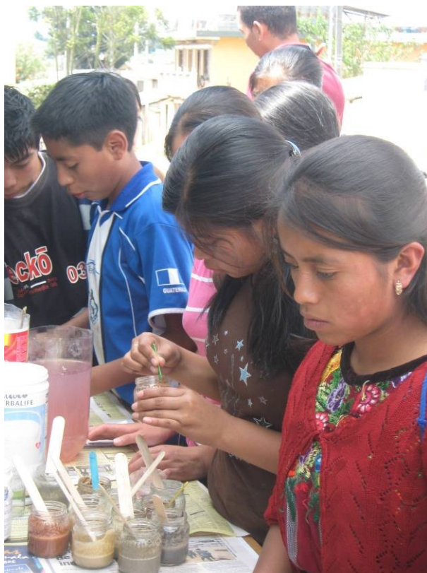
Mezclas de los ingredientes para obtener la pintura.