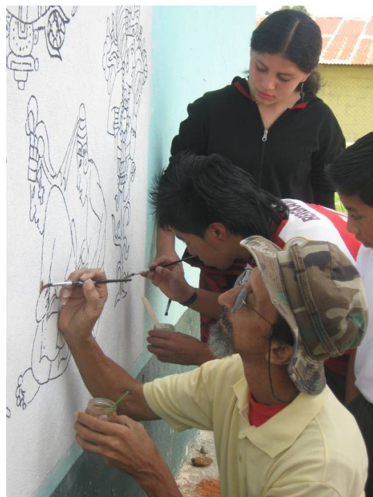
Proceso de aplicación de la pintura.